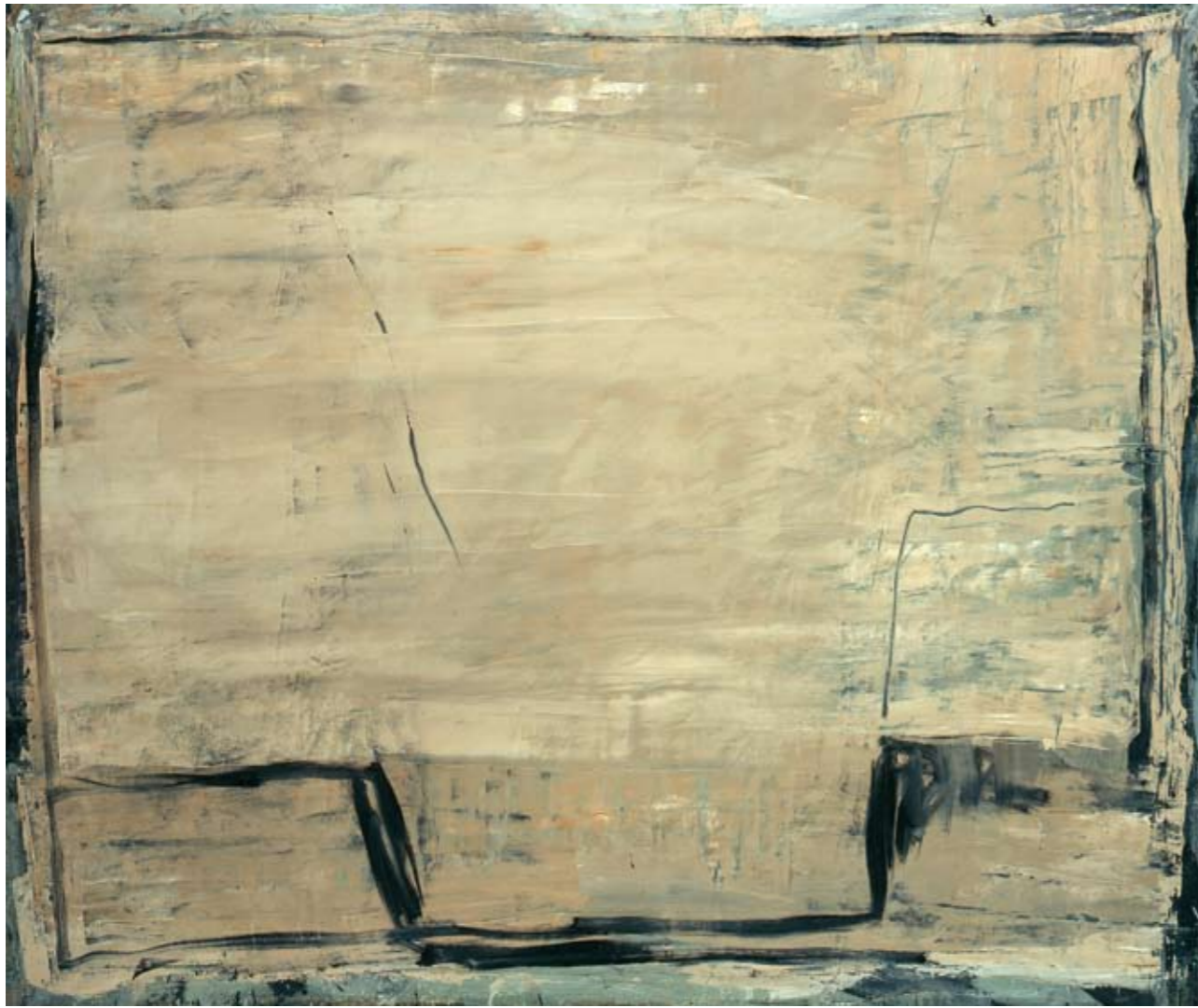
Port-Tudy - île de Groix - 2005 - huile sur isorel - 100 x 120 cm