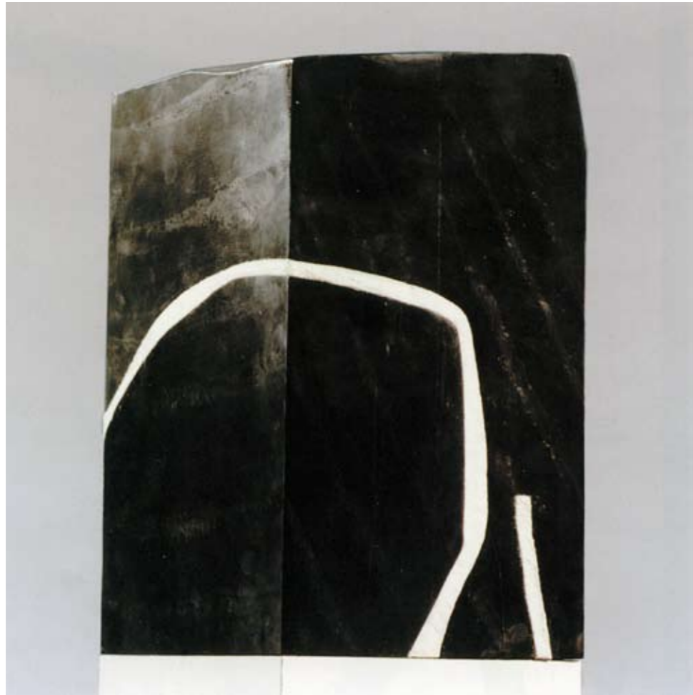
Schiefer und Filz - 35 x 25 x 42 cm - 1999