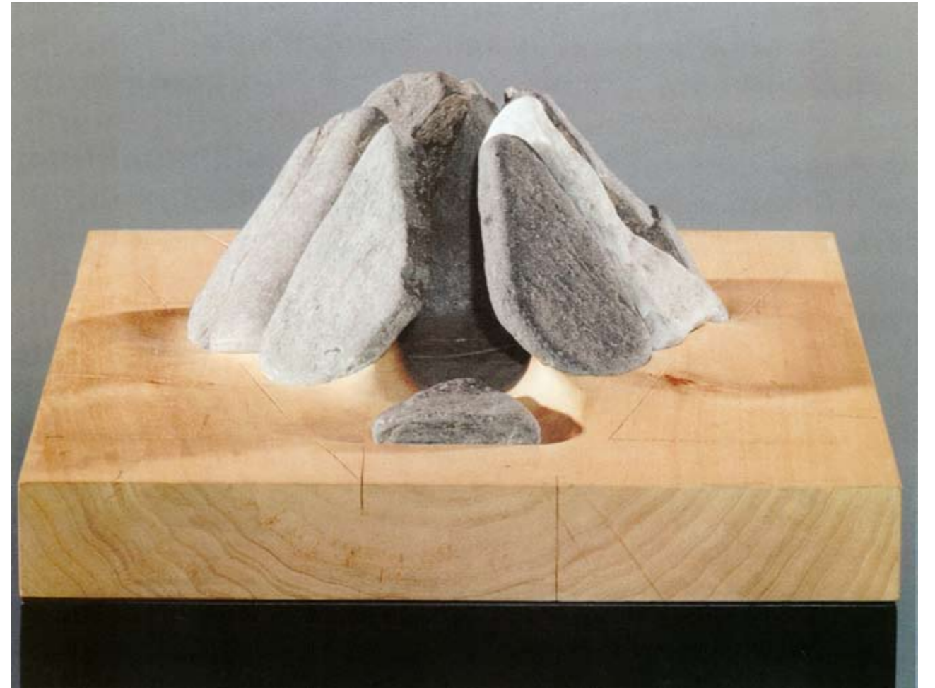
Dix pierres Groisillonnes sur peuplier - 53 x 42,5 x 20,5 cm - 1994