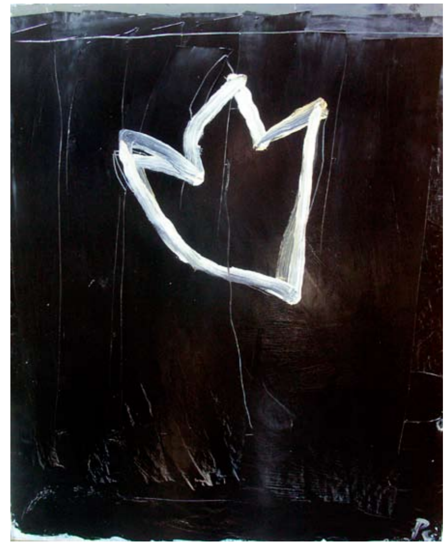
Empreinte - 2006 - huile sur isorel - 98 x 111,5 cm