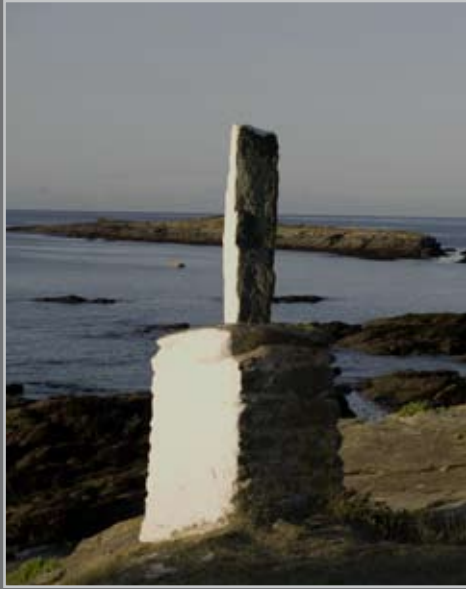
Amer de Kersauce - Ile de Groix - 2008