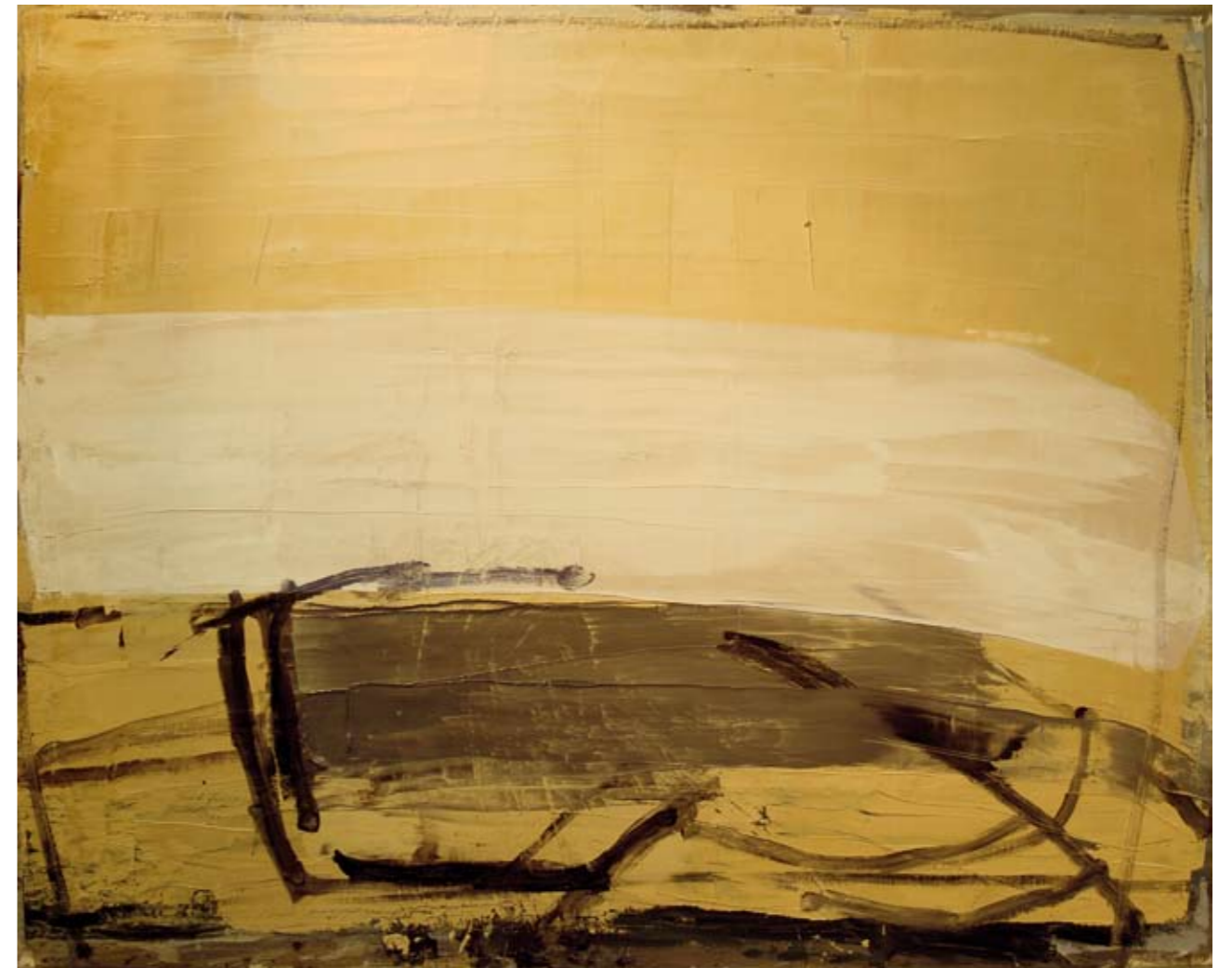
Port-Tudy - 2009 - huile sur toile - 120 x 150 cm