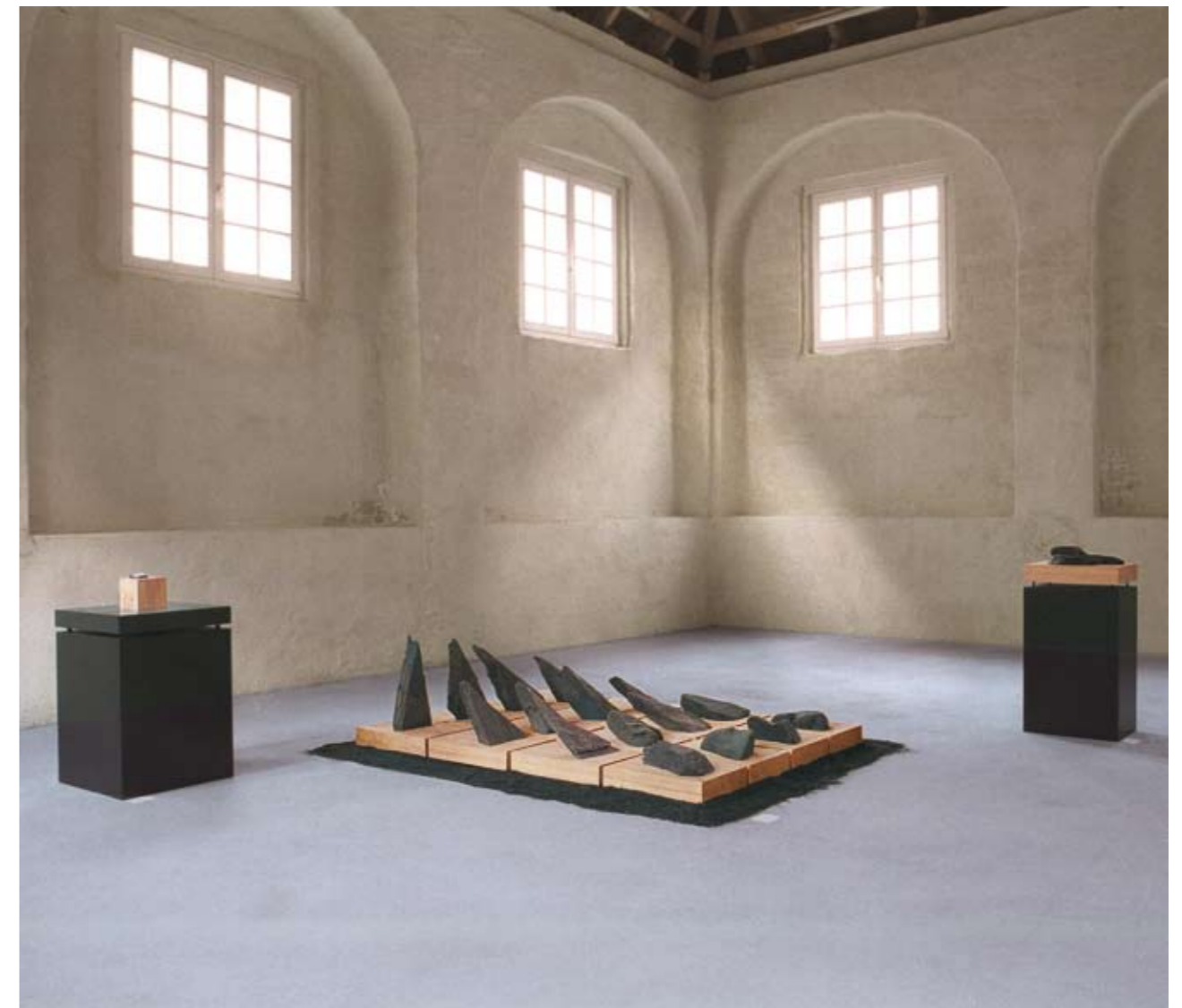
A-P Schiefer in Pappel 16 Teile à 46,7 x 33 cm auf schwarzem Sand = 197 x 138 cm inkl. Abstände - 1992