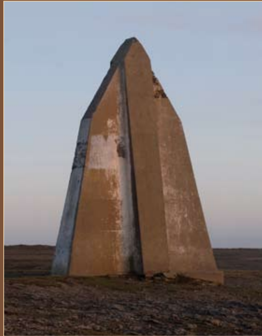
Amer de Kerlard - Ile de Groix - Morbihan