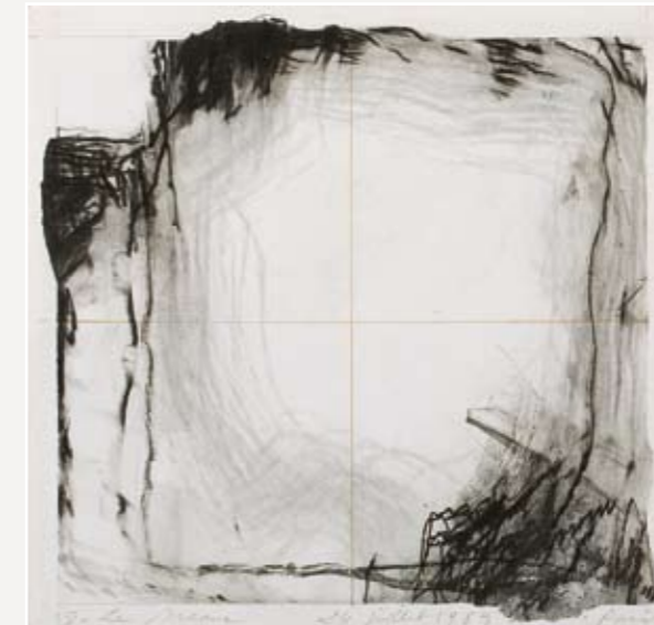
Maen-Sonn (Stèle) - 2006 - gouache et crayon sur papier - 95 x 59,5 cm